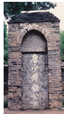
Tombe de Bai Juyi

« Quand les fleurs s'ouvrent, c'est du présent qu'on doit se réjouir 2 . »