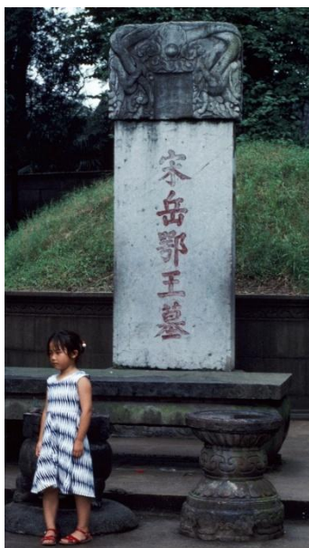
Tombe de Yue Fei à Hangzhou

Permettez-moi de conclure avec un souvenir de Chine. Un été, au début des années 1980, je me trouvais à Hangzhou. Là, comme autrefois Shen Fu, ce lettré du XVIII e siècle, j'eus « le bonheur de pouvoir flâner à loisir dans les divers sites du Lac de l'Ouest 7 ». Je me rendis ainsi sur la tombe, non pas de la célèbre courtisane et... poétesse Su Xiaoxiao que Shen Fu visita, mais sur celle de 岳飛 Yue Fei (1103-1142) qui s'illustra au XII e siècle dans la guerre qui opposa les Jin établis en Chine du Nord à la dynastie des Song. On lui donna le titre posthume de roi de E. La petite fille chinoise de la photo pouvait être fière de se faire photographier devant la tombe du valeureux général dont l'histoire est bien connue en Chine. Contemporaine des événements catastrophiques qui bouleversèrent la Chine à cette époque, la poétesse Li Qingzhao manifesta son esprit de résistance à la politique de compromis avec l'envahisseur rappelant que « l'ennemi est tigre ou loup par tempérament 8 » et appelant à suivre l'exemple de Mulan, la Jeanne d'Arc de la Chine, au moment