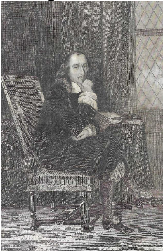
Pierre Corneille (1606-1684)