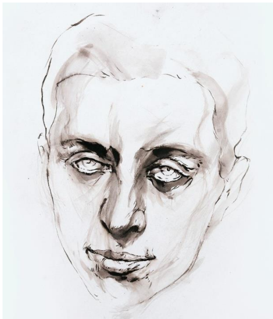
Portrait de Robert Desnos par Ernest Pignon-Ernest Paris, 2001

Le 8 février 1944 – le jour de ma naissance – Robert Desnos notait dans son Journal : « Ce que j'écris ici ou ailleurs n'intéressera sans doute dans l'avenir que quelques curieux espacés au long des années. Tous les vingt-cinq ou trente ans on exhumera dans des publications confidentielles mon nom et quelques extraits, toujours les mêmes. Les poèmes pour enfants auront survécu un peu plus longtemps que le reste. J'appartiendrai au chapitre de la curiosité limitée. 1 » Il n'avait pas tout à fait tort. Il pensait, bien entendu, aux Chantefables et aux Chantefleurs que nous connaissons tous. De fait, Robert Desnos n'a longtemps été pour moi que l'auteur de La Ménagerie de Tristan avec ou sans les notes du compositeur Joseph Kosma :