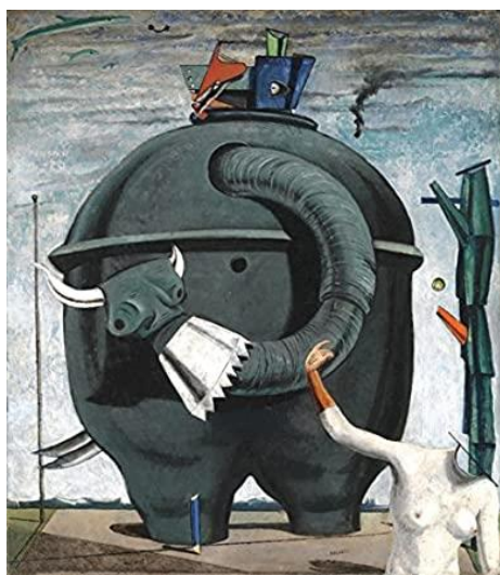
Max Ernst L'Éléphant Célèbes Tate Gallery (Londres)

Le délice d'aller vers des êtres oubliés Par des chemins inoubliables. 11