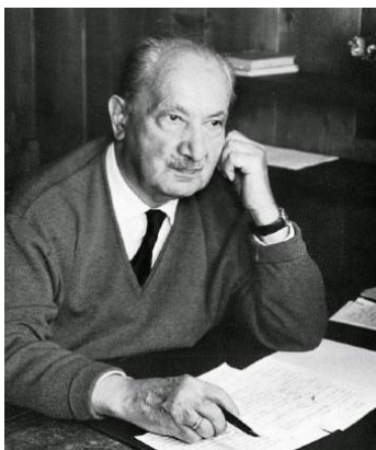
Martin Heidegger (1889-1996)