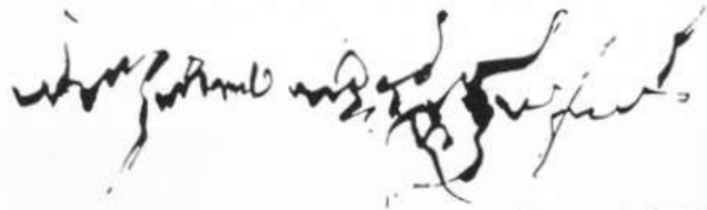
Rythme, geste, voix. Graphie, D.A.